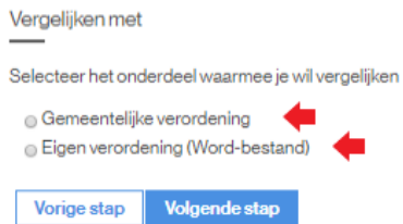
Figuur 2: De soorten verordeningen die gebruikt kunnen worden voor de vergelijking